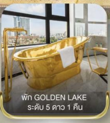
พัก GOLDEN LAKE ระดับ 5 ดาว 1 คืน