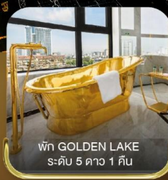
พัก GOLDEN LAKE ระดับ 5 ดาว 1 คืน