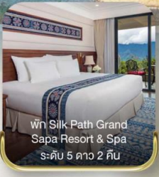
พัก Silk Path Grand Sapa Resort & Spa ระดับ 5 ดาว 2 คืน