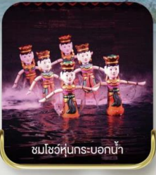
ชมโชว์หุ่นกระบอกน้ำ