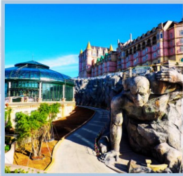
โซน Eclipse Square