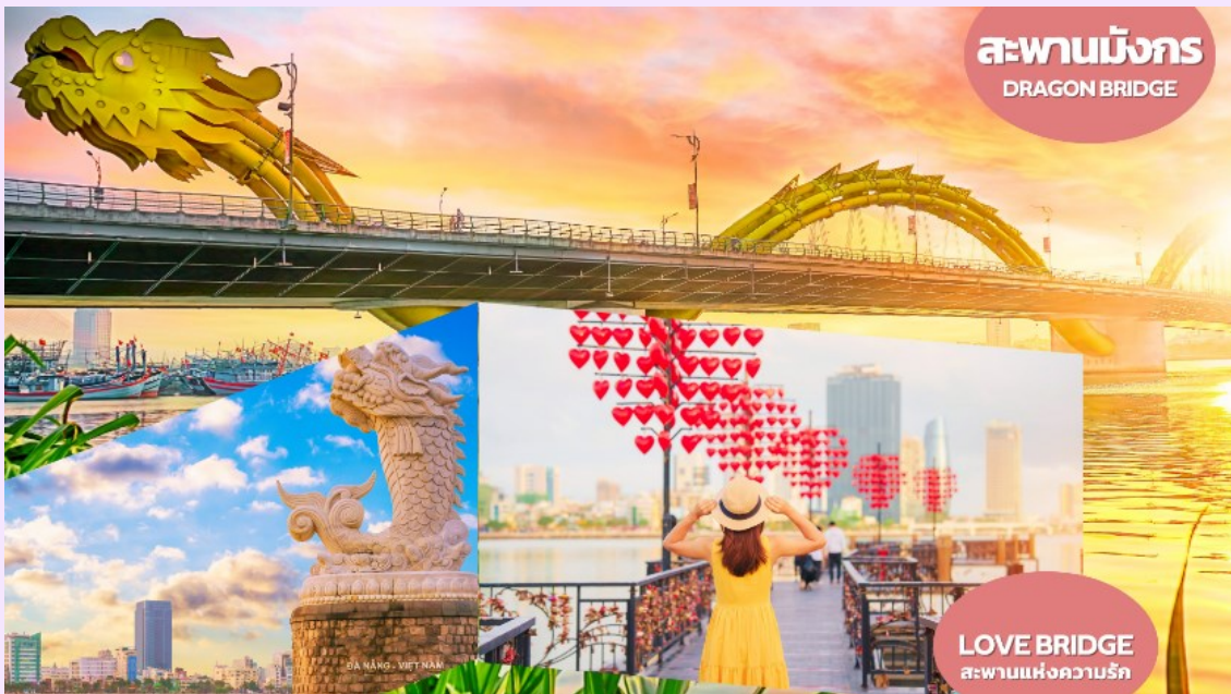
VDAD43FD-16 เวียดนามกลาง เที่ยวคุ้มสุดฟินนน ดานัง ฮอยอัน พักบานาฮิลล์ 4 วัน 3 คืน BY FD 9

นำท่านแวะ ร้านผ้าไหม อิสระในการเลือกซื้อผ้าไหมสไตล์เวียดนาม เช่น ชุดเครื่องนอน เสื้อผ้า ผ้าพันคอ เป็นต้น จากนั้นนำท่านชม สะพานแห่งความรัก (LOVE BRIDGE) ที่คู่รักนิยมพากันมาถ่ายรูป เขียนชื่อคล้องกุญแจบนสะพานแห่งนี้ เป็นอีกจุดที่นิยมสำหรับวัยรุ่นและนักท่องเที่ยว สะพานมังกร (DRAGON BRIDGE) สะพานมังกรไฟ สัญลักษณ์ความสำเร็จแห่งใหม่ของเวียดนาม มีความยาว 666 เมตร ความกว้างเท่าถนน 6 เลนส์ เชื่อมต่อสองฟากฝั่งของแม่น้ำฮานประเทศเวียดนาม สะพานมังกรถูกสร้างขึ้นเพื่อเป็นแหล่งท่องเที่ยว เป็นสัญลักษณ์ของการฟื้นคืนประเทศฟื้นฟูเศรษฐกิจของประเทศโดยได้เปิดใช้งานตั้งแต่ปี 2013 ด้วยสถาปัตยกรรมที่บวกกับเทคโนโลยีสมัยใหม่ที่ได้รับแรงบันดาลใจจากตำนานของเวียดนาม