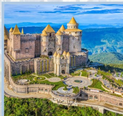
ปราสาทจันตรา