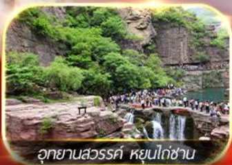
อุทยานสวรรค์ หุบโกซาน