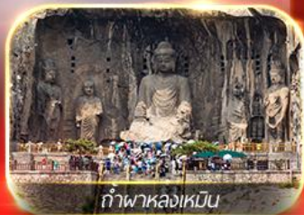
ถ้ำฟาหลงเหมิน