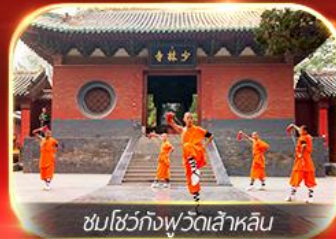
ชมโชว์กึ่งพุทธเจ้าหลิน