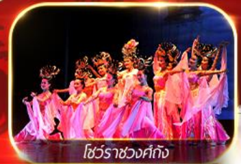
โชว์ราชวงศ์ถัง

สัมผัสความยิ่งใหญ่อลังการกองทัพจีนซีอานเต๋ นั่งรถไฟความเร็วสูงทะลุเมืองโบราณ ย้อนตำนานประวัติศาสตร์จีน