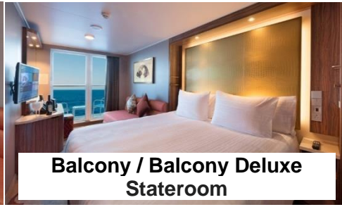
Balcony / Balcony Deluxe Stateroom