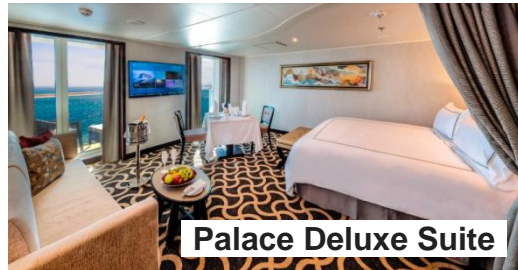
Palace Deluxe Suite