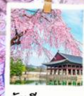
วังเคียงบกกุง