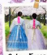
ใส่ชุดฮันบก