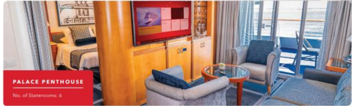
PALACE PENTHOUSE No. of Staterooms: 6

เพื่อประโยชน์ของผู้เดินทาง โปรดศึกษาเงื่อนไขการจองทัวร์ และการยกเลิกทัวร์ ที่ระบุในรายการทั้งหมด หลังจากท่านทำการจองทัวร์แล้ว ทางบริษัทฯจะถือว่าท่านเข้าใจ และพร้อมปฏิบัติตามเงื่อนไขดังกล่าว