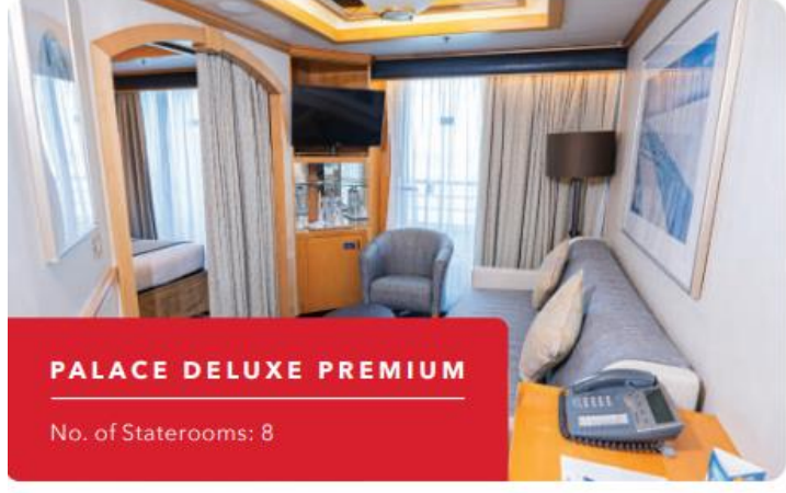
PALACE DELUXE PREMIUM