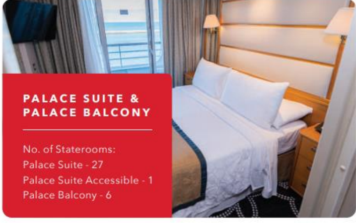
PALACE SUITE & PALACE BALCONY

No. of Staterooms: Palace Suite - 27 Palace Suite Accessible - 1 Palace Balcony - 6