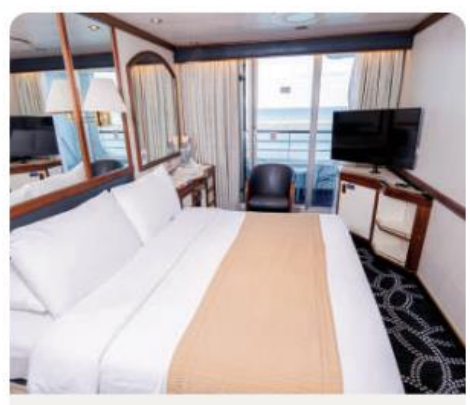
BALCONY DELUXE/ BALCONY STATEROOM

No. of Staterooms: Balcony Deluxe - 28 Balcony - 322