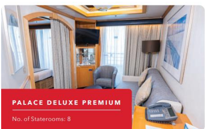
PALACE DELUXE PREMIUM

No. of Staterooms: Interior - 373 Interior Accessible - 12