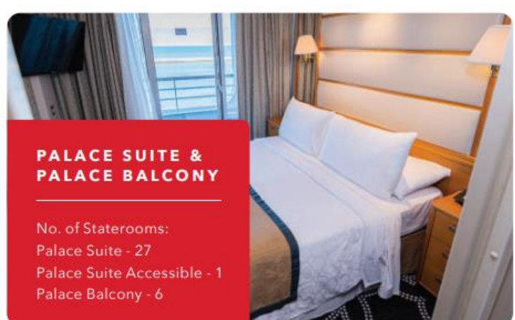
PALACE SUITE & PALACE BALCONY

No. of Staterooms: Palace Suite - 27 Palace Suite Accessible - 1 Palace Balcony - 6