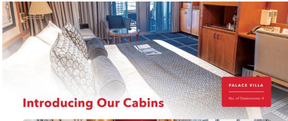
PALACE VILLA No. of Staterooms: 4