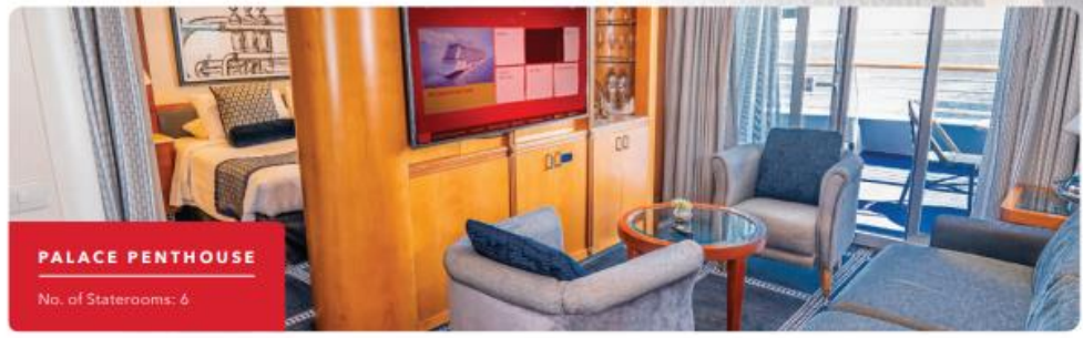
PALACE PENTHOUSE No. of Staterooms: 6