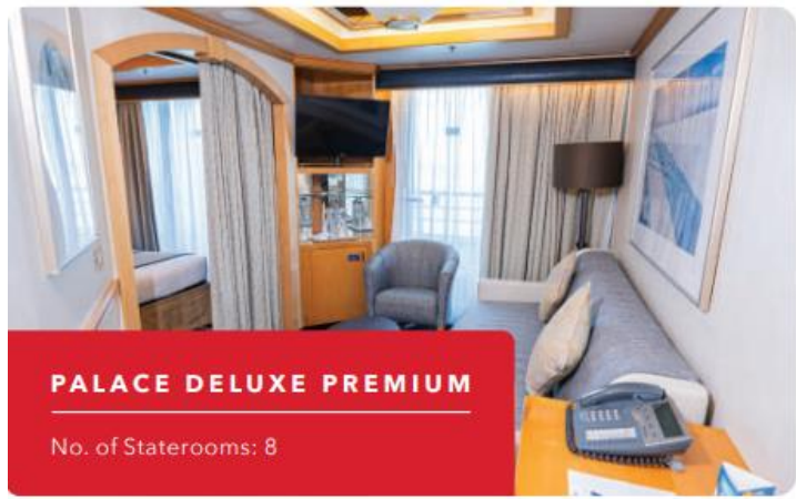
PALACE DELUXE PREMIUM No. of Staterooms: 8