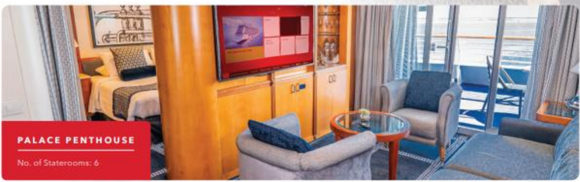
PALACE PENTHOUSE No. of Staterooms: 6

เพื่อประโยชน์ของผู้เดินทาง โปรดศึกษาเงื่อนไขการจองทัวร์ และการยกเลิกทัวร์ ที่ระบุในรายการทั้งหมด หลังจากท่านทำการจองทัวร์แล้ว ทางบริษัทฯจะถือว่าท่านเข้าใจ และพร้อมปฏิบัติตามเงื่อนไขดังกล่าว