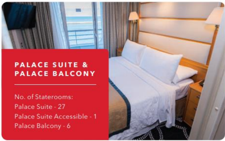
PALACE SUITE & PALACE BALCONY No. of Staterooms: Palace Suite - 27 Palace Suite Accessible - 1 Palace Balcony - 6