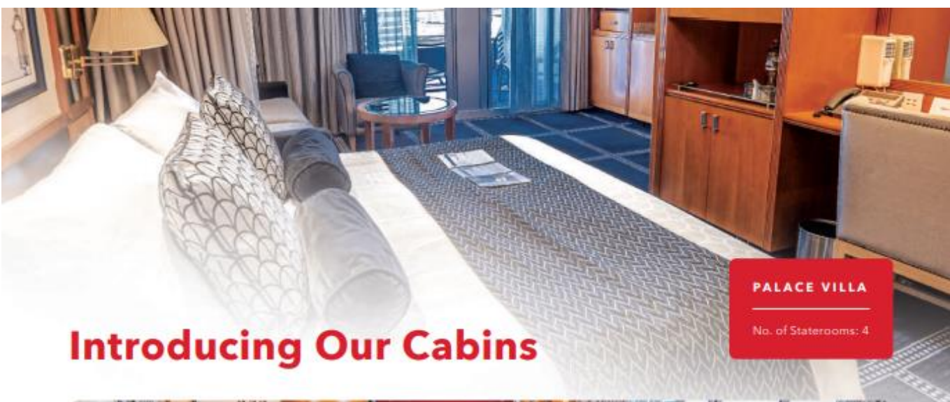
PALACE VILLA No. of Staterooms: 4