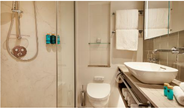
Double Cabin 17 m 2