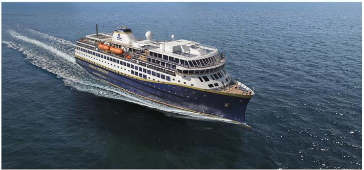
Havila Polaris New and modern environmentally friendly vessel powered by Battery and LNG Built: 2022 Cabins: 179 Passengers: 640