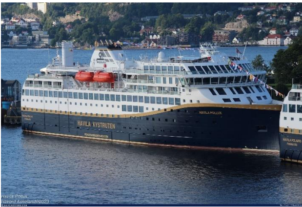
MS Havila Pollux