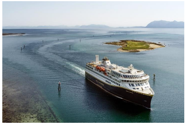
MS Havila Castor