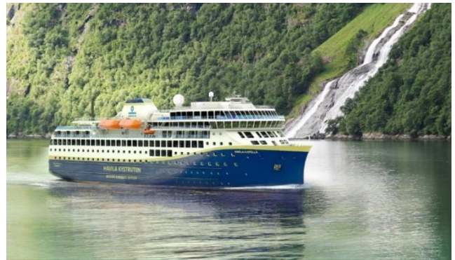
MS Havila Capella