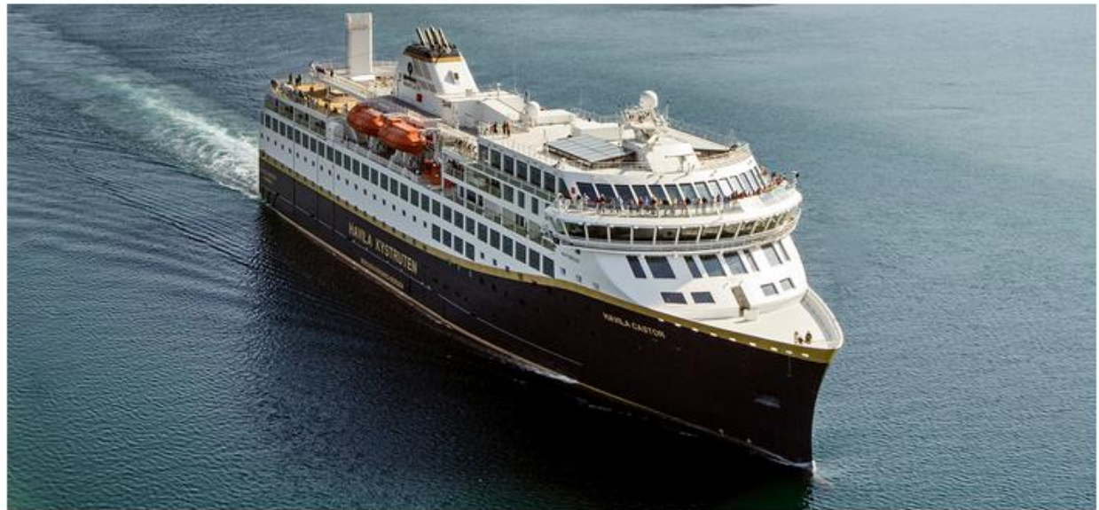
Havila Castor New and modern environmentally friendly vessel powered by Battery and LNG Built: 2022 Cabins: 179 Passengers: 640