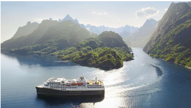
MS Havila Polaris