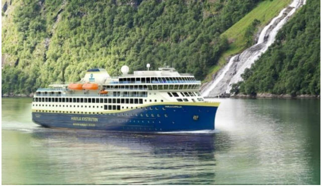
MS Havila Capella