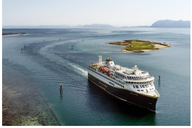
MS Havila Castor