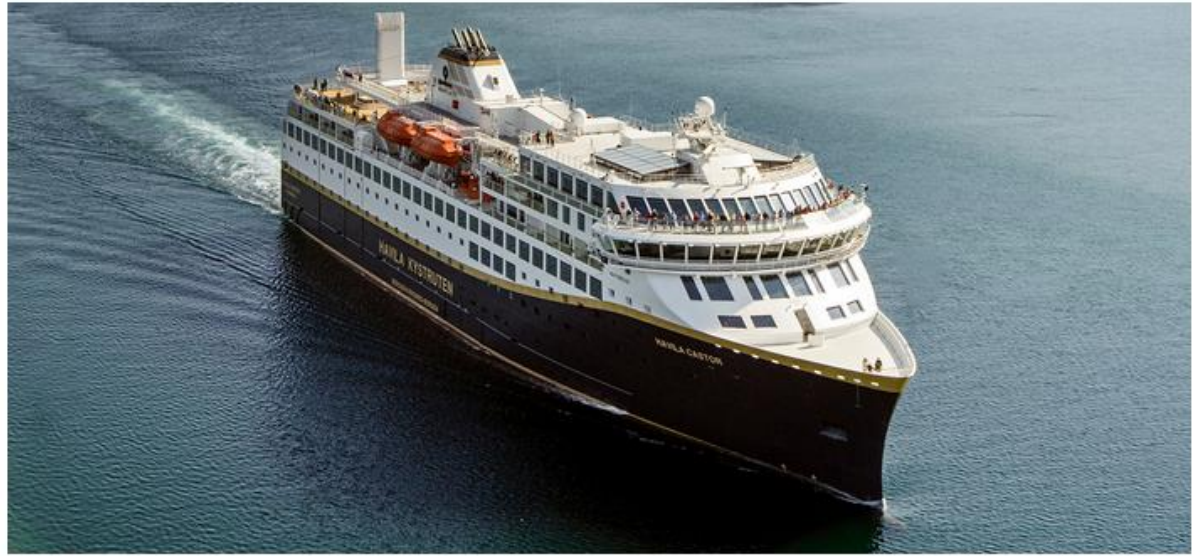
Havila Castor New and modern environmentally friendly vessel powered by Battery and LNG Built: 2022 Cabins: 179 Passengers: 640