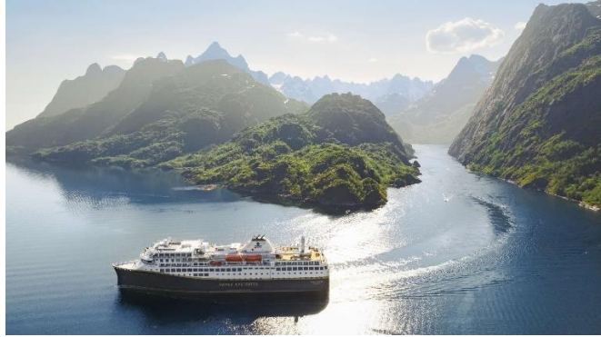
MS Havila Polaris