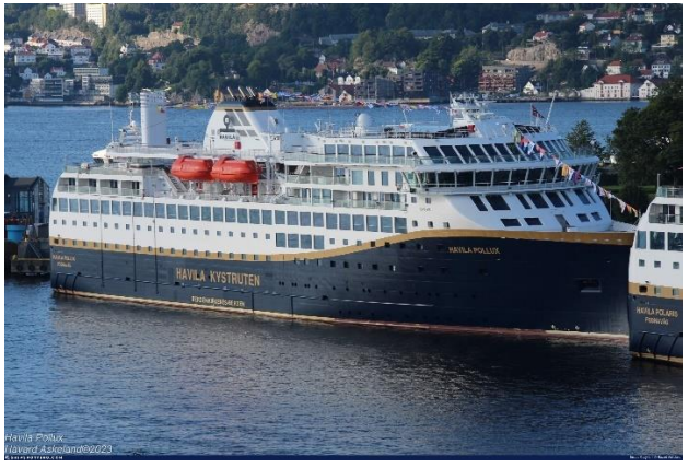
MS Havila Pollux