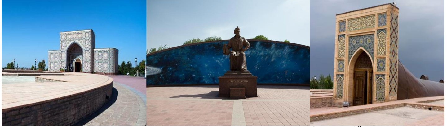
ชม หอดูดาวอูลูก เบค (Ulug Beg Observatory) เป็นสถานที่เก็บอุปกรณ์ที่ใช้ดูดาว สร้างโดย ชาห์อูลูก เบค ซึ่งแสดงให้เห็นถึงความอัจฉริยะทางดาราศาสตร์ของท่าน รับประทานอาหารเย็น ณ ภัตตาคาร