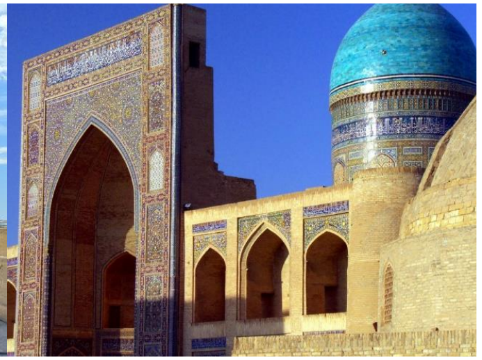
ชมด้านนอก โรงเรียนสอนศาสนา มิริ อหรับ (Miri Arab Madrassah) เอเมียร์ อาลิม ข่าน (Amir Alim Khan) ที่ถูกสร้างอยู่ในบริเวณเดียวกันกับสุเหร่าคัลยาน ชื่อสถานที่แห่งนี้ได้ถูกตั้งตามชื่อของครูที่มาสอน มิริ อหรับ ซึ่งมีความหมายว่า เจ้าแห่งอาหรับ

ค่า ที่พัก รับประทานอาหารค่ำ ณ ภัตตาคาร ➡ Hotel Asia Bukhara 4* (เมืองบูคาร่า) หรือเทียบเท่า