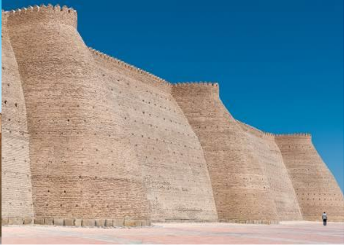
เข้าชม บ้อมดิอาร์ค (The Ark Fortress) เป็นบ้อมเก่าแก่ตั้งอยู่ใจกลางเมือง และเมื่อขึ้นไปด้านบนของบ้อม จะสามารถเห็นวิวทิวทัศน์ของเมืองได้อย่างชัดเจน