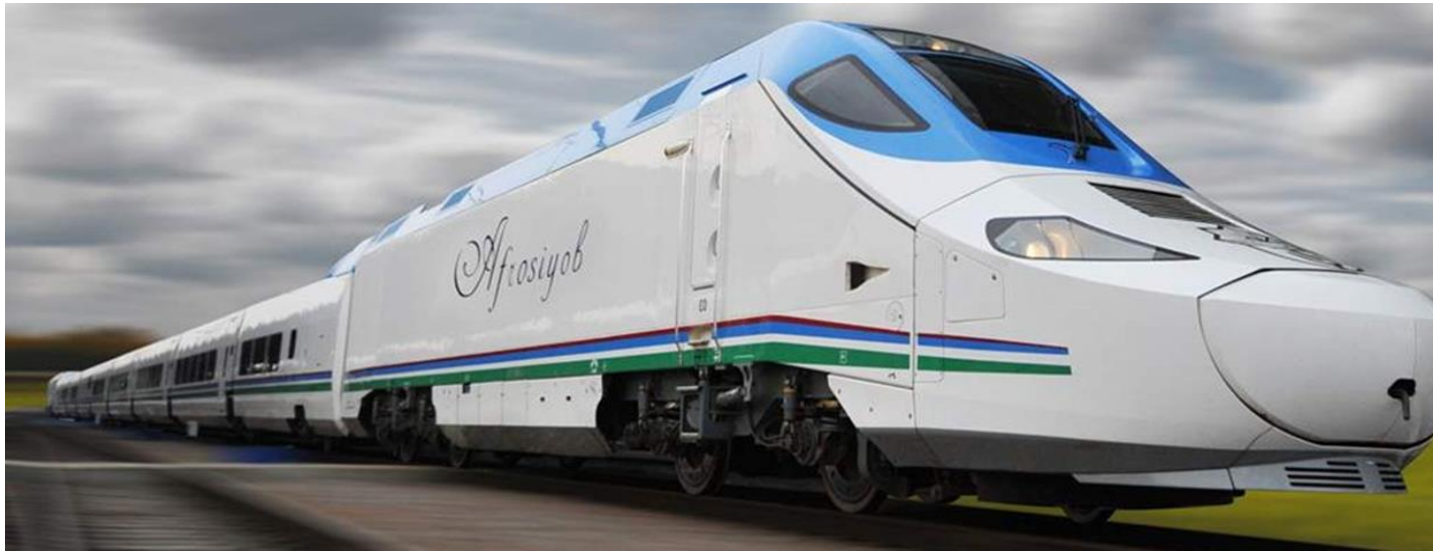
จากนั้นเดินทางต่อไปยังสถานีรถไฟ เพื่อนั่งรถไฟความเร็วสูง (Afrosiyob Train) กลับสู่ เมืองทาชเคนท์ (Tashkent)