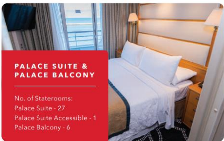
PALACE SUITE & PALACE BALCONY No. of Staterooms: Palace Suite - 27 Palace Suite Accessible - 1 Palace Balcony - 6