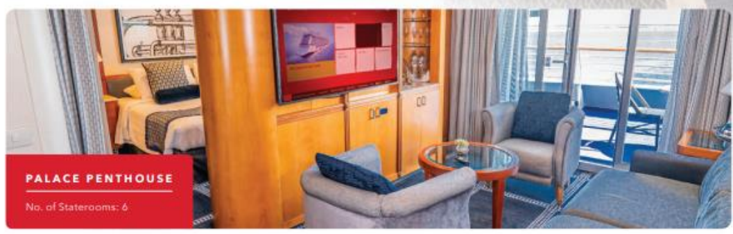
PALACE PENTHOUSE No. of Staterooms: 6