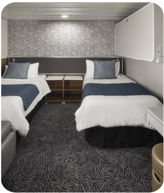
ห้องพักแบบไม่มีหน้าต่าง 14-26 ตร.ม