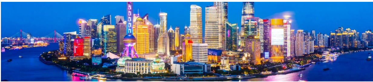
รายละเอียดการเดินทาง

วันแรก กรุงเทพฯ สนามบินสุวรรณภูมิ- เชียงไฮ้ (HO1358 01.30-06.50 น.)