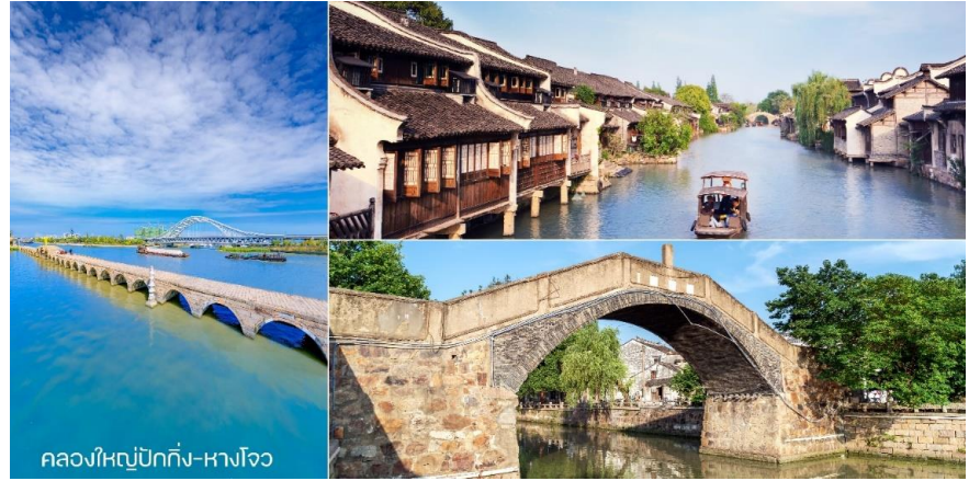
คลองใหญ่ปักกิ่ง-หางโจว

กลางวัน บริการอาหารกลางวัน ณ ภัตตาคาร พิเศษ!! ขาหมูเซี่ยงไฮ้