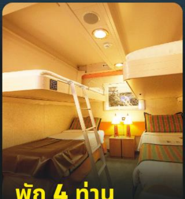
พัก 4 ท่าน