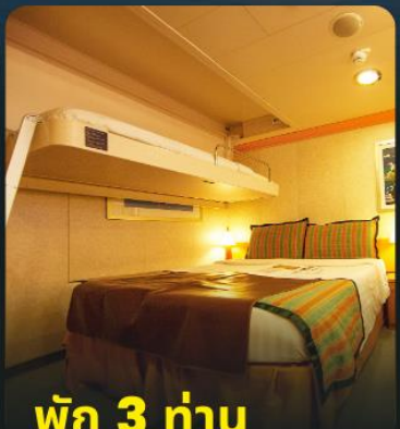
พัก 3 ท่าน