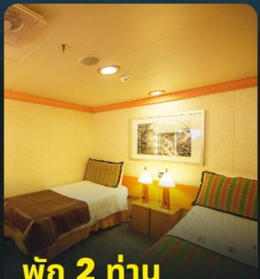
พัก 2 ท่าน

*** ห้องพรีเมียมมีอยู่ชั้นสูงกว่า แต่บางครั้งอาจอยู่ชั้นเดียวกับคลาสสิก สามารถริเคิวสรวบอาหารค่ำได้ แต่บางครั้ง เรืออาจยกเลิกการแบ่งรอบอาหาร ***