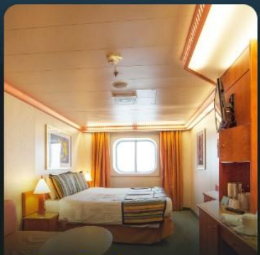
พัก 2 ท่าน

*** ห้องพรีเมียมมักอยู่ชั้นสูงกว่า แต่บางครั้งอาจอยู่ชั้นเดียวกับคลาสสิก สามารถริควอร์สอบอาหารค่ำได้ แต่บางครั้ง เรืออาจยกเลิกการแบ่งรอบอาหาร ***