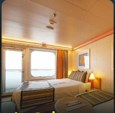
พัก 3 ท่าน