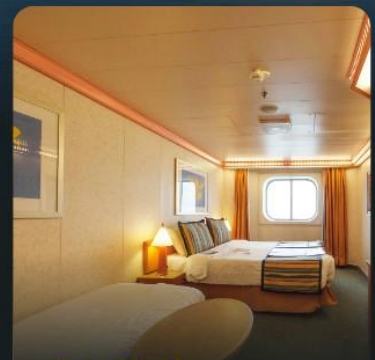
พัก 3 ท่าน