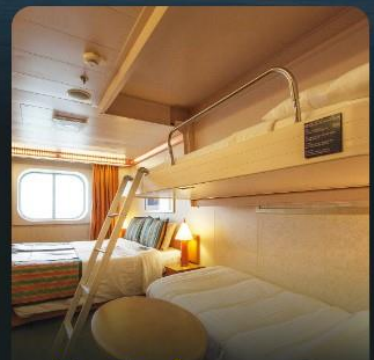
พัก 4 ท่าน