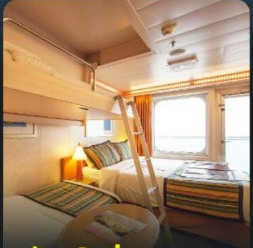
พัก 4 ท่าน