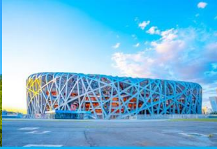
สนามกีฬาโอลิมปิก