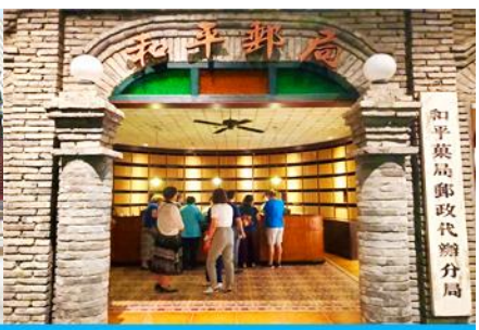
เมืองโบราณจำลอง