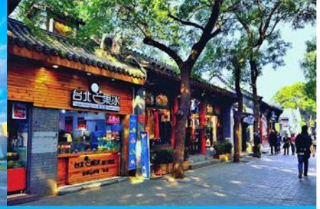
ชอยหนานหลัวกู่เซียง