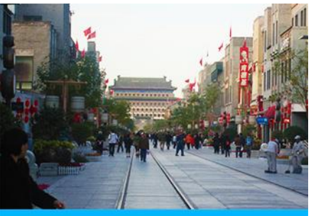
ถนนเจียนเหมิน