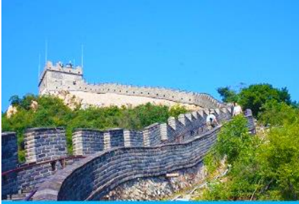
กำแพงเมืองจีนด่านฉวิยงกวน