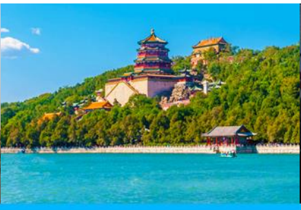
พระราชวังฤดูร้อนหยี่เหอหยวน