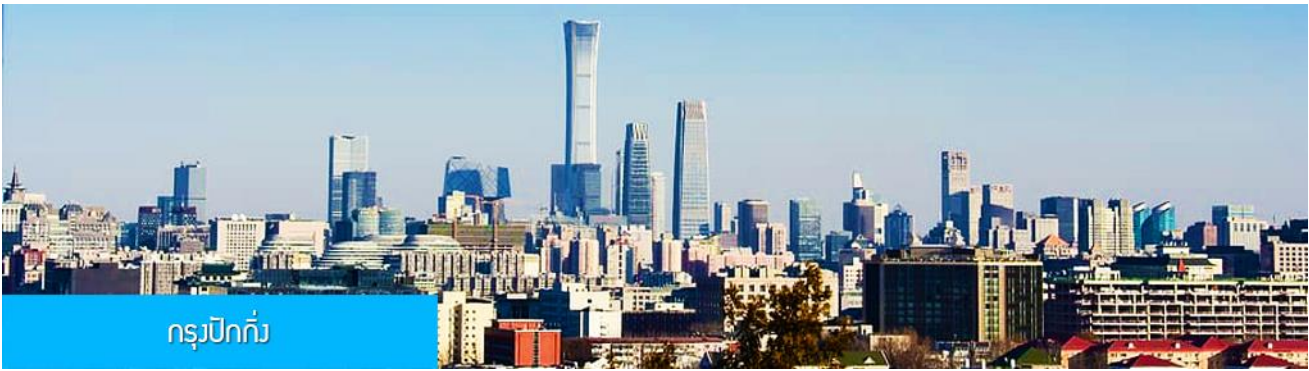
กรุงปักกิ่ง