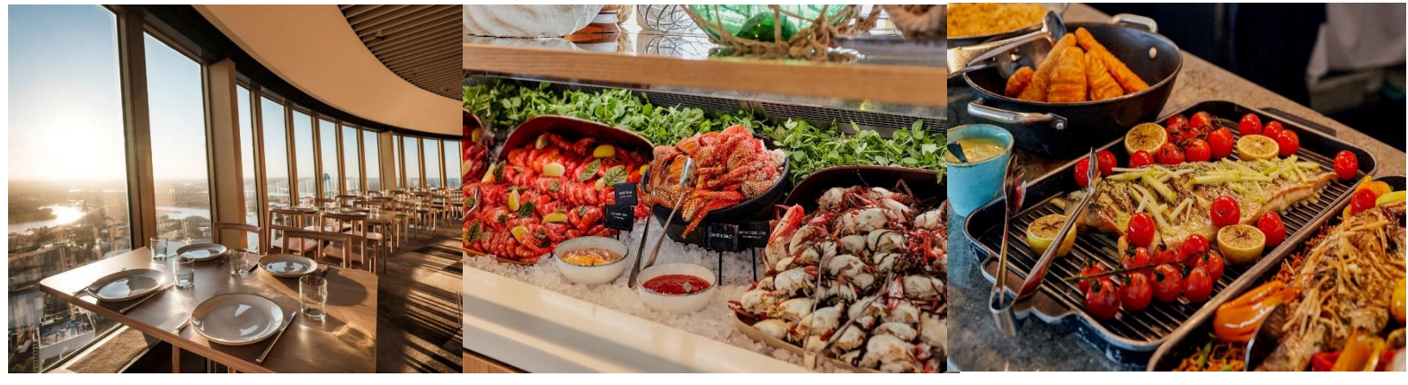
* รูปเพื่อการโฆษณาเท่านั้น *