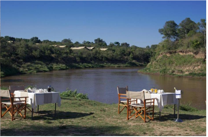
ค่ำ รับประทานอาหารค่ำ ณ ห้องอาหารของที่พัก พักที่ ASHNIL MARA CAMP หรือเทียบเท่า (คืนที่5)