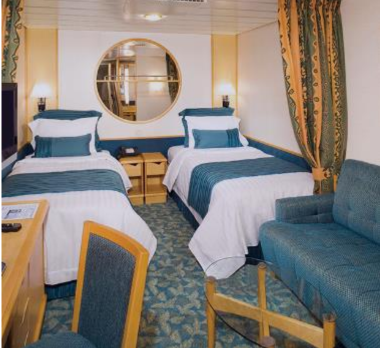
ห้องไม่มีหน้าต่าง Inside

หมายเหตุ : โปรแกรมทัวร์เป็นราคาพิเศษ อาจเปลี่ยนแปลงได้ตามความเหมาะสม ขึ้นอยู่กับสภาพดินฟ้าอากาศ และปัจจัยอื่นๆที่อยู่ นอกเหนือการควบคุม โดยทางบริษัทจะคำนึงถึงความปลอดภัยของลูกค้าเป็นสำคัญ