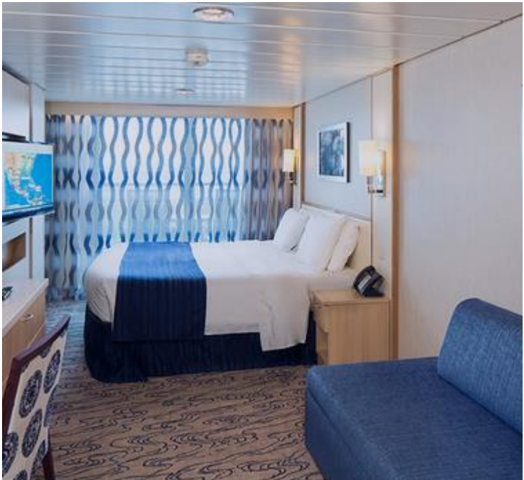
ห้องมีระเบียงส่วนตัว Balcony