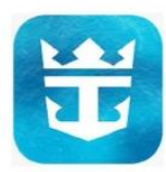
Royal Caribbean International App.

โหลดแอป Royal Caribbean ไว้ในมือถือ เพื่อลงทะเบียน และ โหลดตั๋วเรือสำราญ