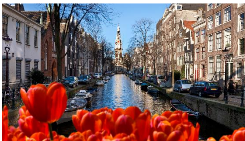
เรือจอดพักค้างคืนที่ อัมสเตอร์ดัม