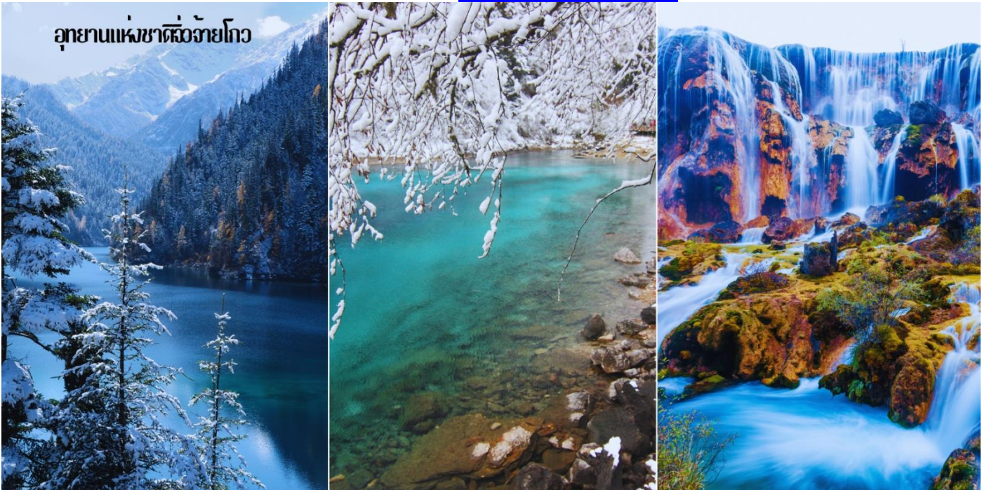
อุทยานแห่งชาติชิงฝิงโกว

กลางวัน 10 | บริการอาหารกลางวัน ณ ภัตตาคาร(6) (ห้องอาหารภายในอุทยาน)