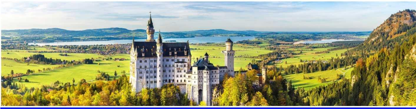
GG31 อิตาลี สวิตเซอร์แลนด์ เยอรมนี ออสเตรีย 9 วัน 6 คืน

บ่าย นำท่านเดินทางขึ้นปราสาทชมความสวยงามของ ปราสาทนอยชวานชไตน์ (Neuschwanstein Castle) โดยรถบัสเล็ก (หากช่วงที่หิมะตก พนักงานจะหยุดให้บริการแก่นักท่องเที่ยว เนื่องจากเพื่อความปลอดภัยทางบริษัทฯ จะนำคณะเดินขึ้น-ลงปราสาท เนื่องจากเวลาหิมะตกทางจะลื่นและอันตราย) นำท่านเข้าชมต้นแบบของปราสาทเจ้าหญิงนิทราในดิสนีย์แลนด์ ซึ่งปราสาทนอยชวานชไตน์ ตั้งตระหง่านอยู่บนยอดเขาสูงปราสาทในเทพนิยาย ซึ่งเป็นปราสาทของพระเจ้าลูดวิกที่ 2 หรือ เจ้าชายหงส์ขาว พระเจ้าลูดวิกทรงเป็นบุคคลที่มีลักษณะนิสัยที่ลึกลับเป็นปริศนา(eccentric) และผู้ที่สิ้นพระชนม์ในสถานการณ์ที่ค่อนข้างมีเงื่อนไข สุขภาพจิตของพระองค์ในบั้นปลายอาจจะไม่ปกติแต่ก็ไม่มีหลักฐานทางการแพทย์ที่เป็นที่ยืนยันได้แน่นอน แต่สิ่งที่ทรงทิ้งไว้เป็นมรดกแก่ชนรุ่นหลังคืองานทาง