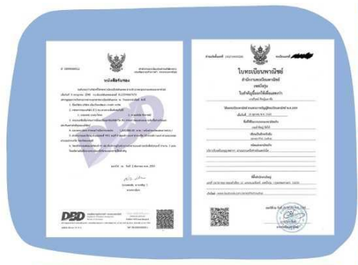
ตัวอย่างหนังสือจดทะเบียนบริษัท และ ใบทะเบียนพาณิชย์