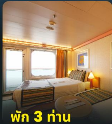
พัก 3 ท่าน