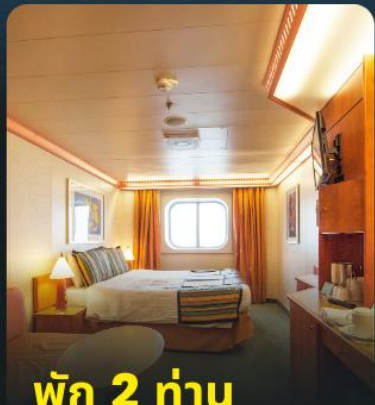
พัก 2 ท่าน

*** ห้องพรีเมียมมักอยู่ชั้นสูงกว่า แต่บางครั้งอาจอยู่ชั้นเดียวกับคลาสสิก สามารถริเวอรวอร์คได้ แต่บางครั้ง เรืออาจยกเลิกการแบ่งรออาหาร ***