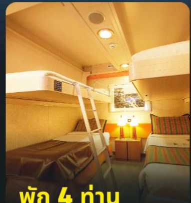
พัก 4 ท่าน