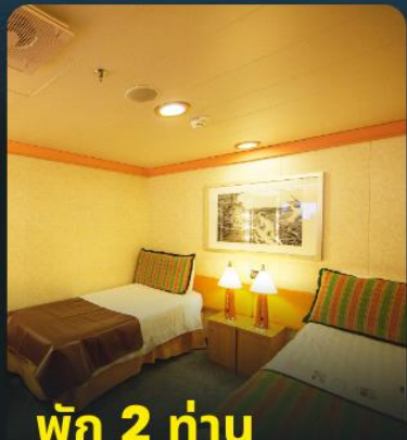
พัก 2 ท่าน

*** ห้องพรีเมียมมักอยู่ชั้นสูงกว่า แต่บางครั้งอาจอยู่ชั้นเดียวกับคลาสสิก สามารถรีแควรอบอาหารค่ำได้ แต่บางครั้ง เรืออาจยกเลิกการแบ่งรอบอาหาร ***