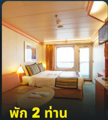
พัก 2 ท่าน

*** ห้องพรีเมียมมักอยู่ชั้นสูงกว่า แต่บางครั้งอาจอยู่ชั้นเดียวกับคลาสสิก สามารถริเวอรวอร์คอาหารเช้าได้ แต่บางครั้ง เรืออาจยกเลิกการแบ่งอาหารเช้า ***