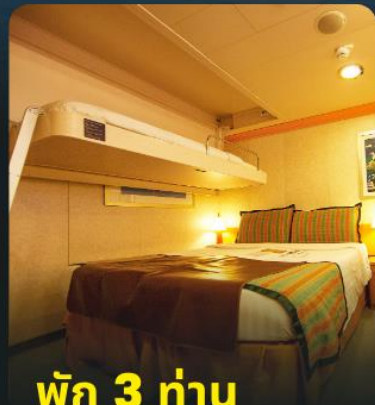
พัก 3 ท่าน