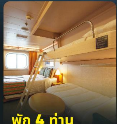
พัก 4 ท่าน