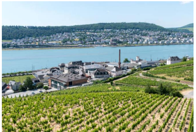
รายการทัวร์ที่น่าสนใจ เที่ยวชมปราสาททอรัลราต และชิมไวน์