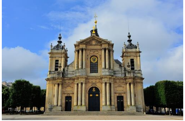
รายการทัวร์ที่น่าสนใจ ชมพระราชวังแวร์ซาย อพาร์ทเมนต์แห่งความลับ