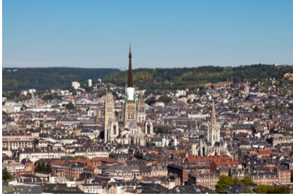
เย็น รับประทานอาหารเย็น ณ ห้องอาหาร Le Restaurant Pigalle เรือล่องออกจากเมืองรูอ็อง