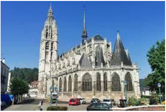
ท่านสามารถเลือก ทัวร์เดินชมเมืององเฟลอ หรือ ทัวร์ตีกอล์ฟที่แอเทรอตตา