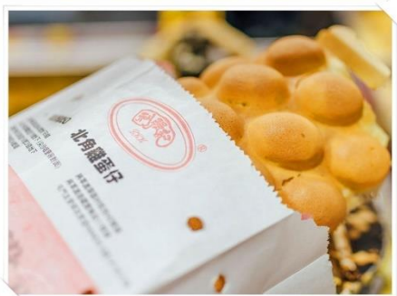
ต้า อิสระรับประทานอาหารค่ำตามอัธยาศัย