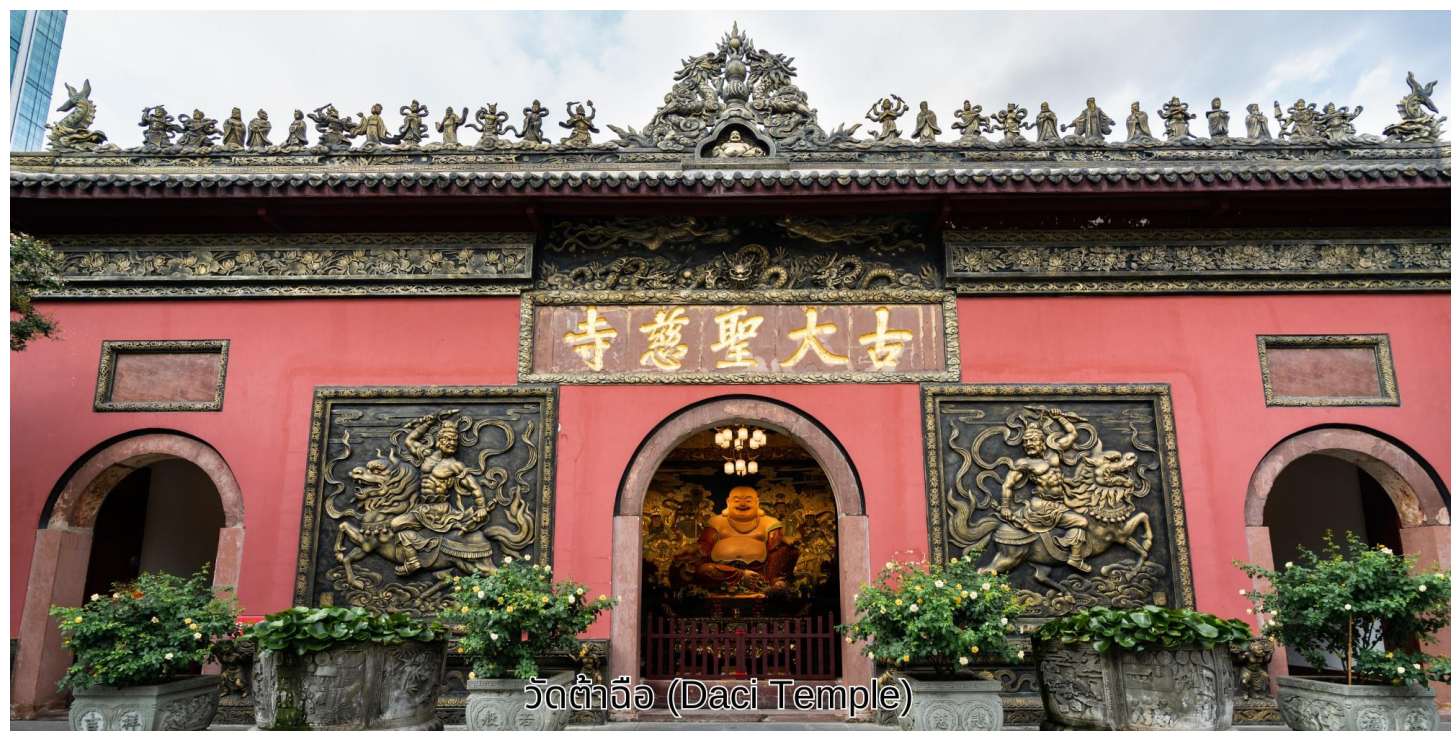
วัดต้าจื่อ (Daci Temple)

บริการอาหารเช้า ณ ห้องอาหารของโรงแรม จากนั้นเดินทางไปยัง วัดต้าจื่อ เป็นวัดเก่าแก่ที่มีอายุยาวนานกว่า 1,600 ปี ตั้งอยู่ใจกลางของ Chengdu ที่นี่ถือเป็นสถานที่สำคัญที่น่าสนใจเพราะเป็นวัดที่พระถังซำจั๋งบวชเป็นพระภิกษุก่อนจะย้ายไปจำพรรษายังวัดอื่นภายในวัดต้าจื่อที่นั่นเงียบสงบ