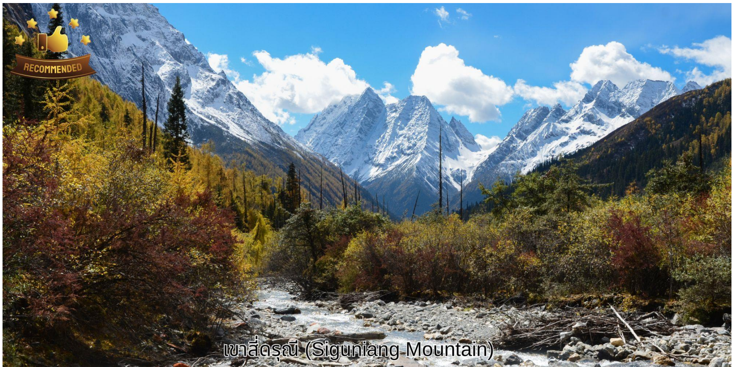
เขาสี่ดรุณี (Siguniang Mountain)

นำท่านเดินทางประมาณ 3 ชั่วโมงสู่ ภูเขาสี่ดรุณี หรือชื่อเรียกเป็นภาษาจีนว่า ชื่อภูเขาหนิงชาน (รวมมรดกอุทยาน) ตั้งอยู่ในอุทยานฉางผิง เขตปกครองตนเองอาปั๋ว มณฑลเสฉวน ทางตะวันตกเฉียงใต้ของจีน มีเนื้อที่กว่า 2,000 ตารางกิโลเมตร ปัจจุบันได้รับการขึ้นทะเบียนเป็นอุทยานแห่งชาติระดับ 5A และที่ได้รับความนิยมเพราะมีทิวทัศน์ที่สวยงามและมีลักษณะยิ่งใหญ่และสูงชัน คล้ายเทือกเขาแอลป์ในยุโรปตอนใต้ เป็นภูเขาที่ตั้งเรียงรายต่อกัน 4 ลูก บนที่ราบสูงจากทิศเหนือถึงทิศใต้ เป็นระยะทาง 3.5 กิโลเมตร ตั้งอยู่ระหว่างธารน้ำใสฉางผิงโกวกับไห่จื่อโกว โดยมีความสูงเหนือระดับน้ำทะเลคือ 6,250 / 5,664 / 5,454 และ 5,355 เมตร และมีหิมะปกคลุมตลอดทั้งปี เหมือนสิริษะที่คลุมด้วยผ้าสีขาวของหญิงสาว 4 คน ประกอบด้วยยอดเขา 4 ลูก เรียงกันบนพื้นที่ราบสูง ประกอบด้วย ต้าภูเขาหนิงเฟิง แปลว่า พี่สาวคนโต, เอ้อภูเขาหนิงเฟิง แปลว่า พี่สาวคนรอง, ซานภูเขาหนิงเฟิง แปลว่า พี่สาวคนกลาง, เหยาภูเขาหนิงเฟิง แปลว่า น้องสาวคนสุดท้อง ตามตำนานเล่าว่าเป็นยอดเขาที่สูงที่สุดคือน้องสาวคนสุดท้องเพราะตามธรรมเนียมท้องถิ่น น้องจะมีความเป็นอยู่สบายที่สุด ร่างกายจึงเจริญเติบโตได้ดีที่สุด ส่วนพี่นั้นต้องทำงานช่วยพ่อแม่ เลี้ยงน้อง ร่างกายจึงเจริญเติบโตได้ไม่เต็มที่ ทำให้กลายเป็นภูเขาที่มีขนาดเล็กที่สุดนั่นเอง