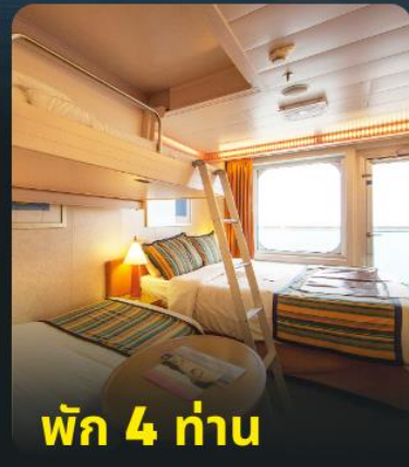
พัก 4 ท่าน