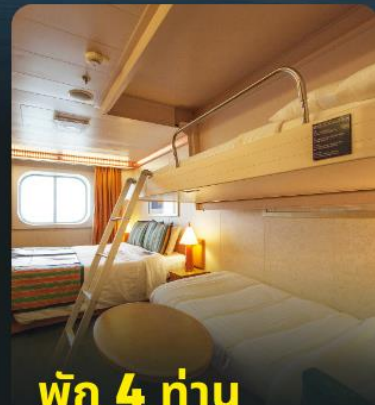
พัก 4 ท่าน