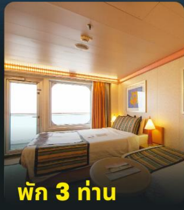
พัก 3 ท่าน