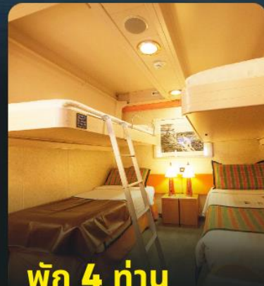
พัก 4 ท่าน