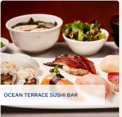
OCEAN TERRACE SUSHI BAR