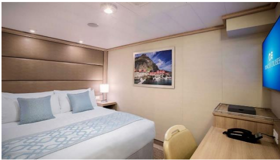
ห้องพักแบบมีหน้าต่าง (Premium Oceanview)