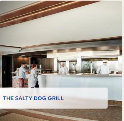
THE SALTY DOG GRILL