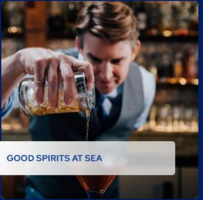
GOOD SPIRITS AT SEA