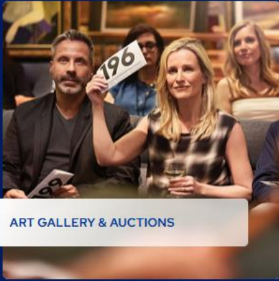
ART GALLERY & AUCTIONS