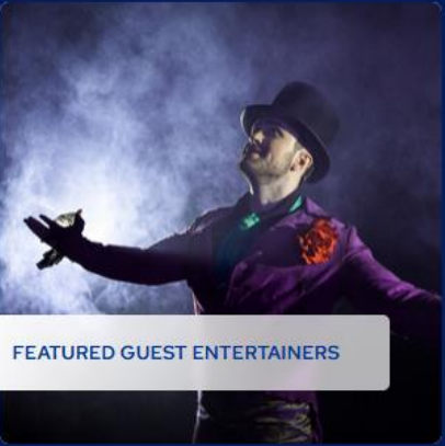
FEATURED GUEST ENTERTAINERS