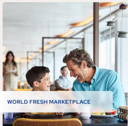
WORLD FRESH MARKETPLACE