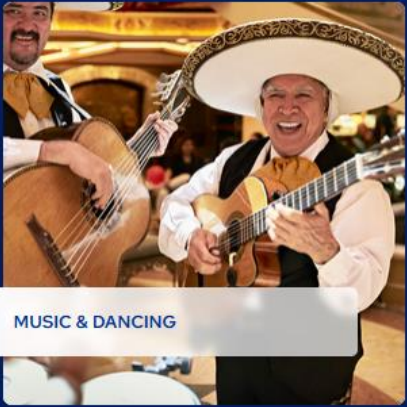
MUSIC & DANCING