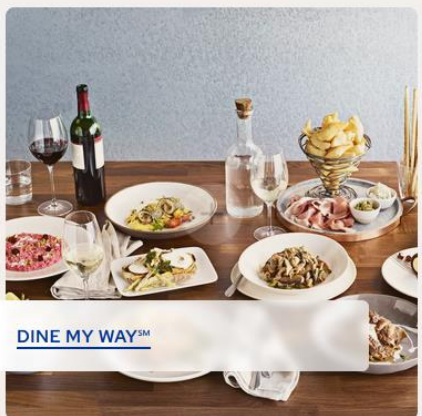
DINE MY WAY SM