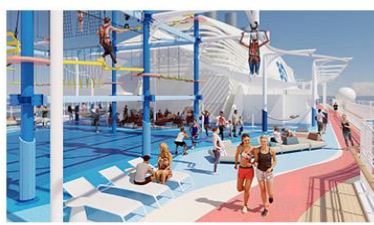
Sea Breeze Rollglider® and The Net Ropes Course