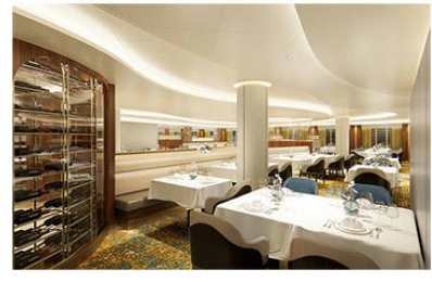
Reserve Collection Restaurant