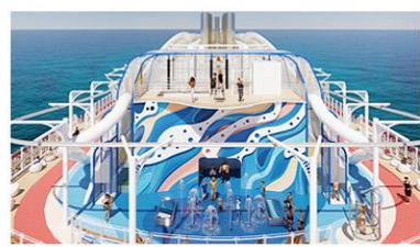
Coastal Climb, Splash Pad & The Lookout