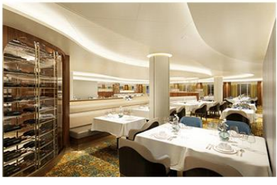
Reserve Collection Restaurant