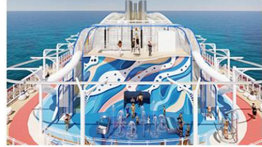
Coastal Climb, Splash Pad & The Lookout