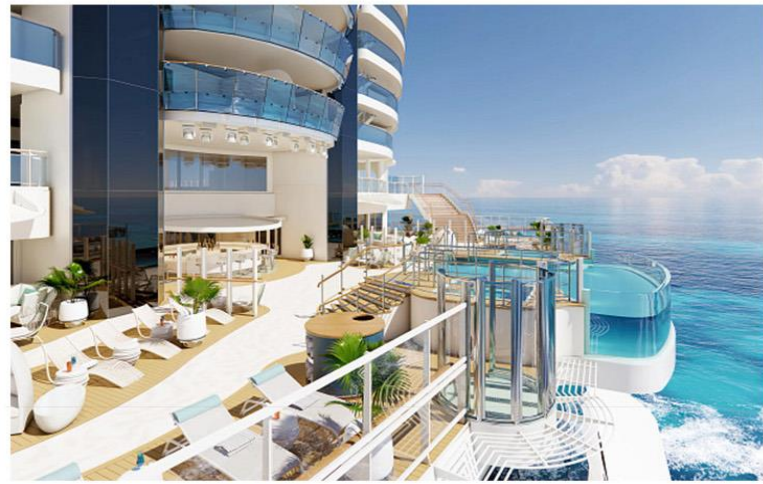
Wake View Terrace