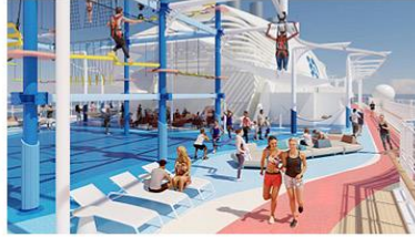
Sea Breeze Rollglider® and The Net Ropes Course