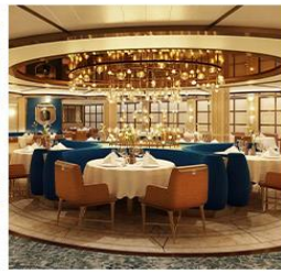
Sabatini's Italian Trattoria