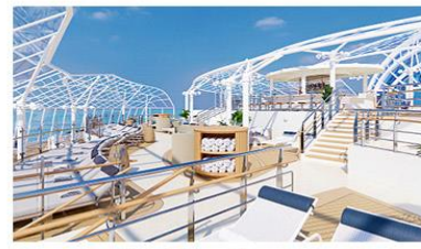
Sea View Terrace