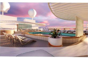
Signature Sun Deck

Introducing the Signature Collection, exclusively on Sun Princess®. In addition to premium stateroom amenities, Signature Collection Suites include access to the Signature Restaurant, Signature Lounge and private Signature Sun Deck, a private area of the Sanctuary.