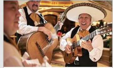
Music & Dancing