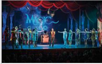
Original Musical Productions