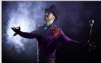
Featured Guest Entertainers