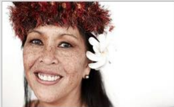
Festivals of the World