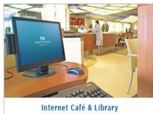
Internet Café & Library