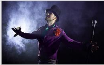
Featured Guest Entertainers