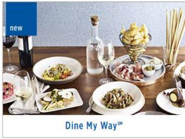
Dine My Way SM