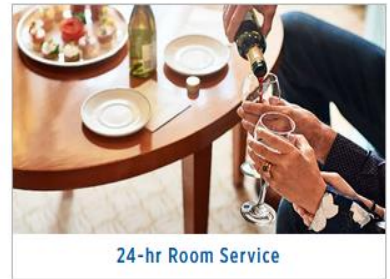
24-hr Room Service