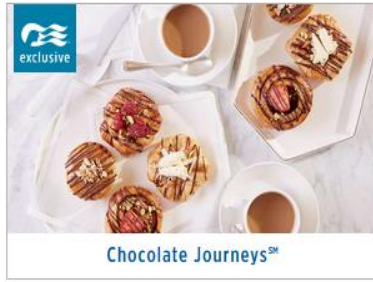
Chocolate Journeys SM