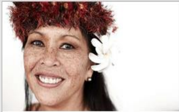
Festivals of the World