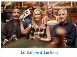
Art Gallery & Auctions