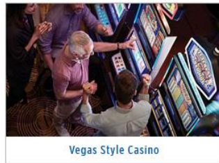
Vegas Style Casino