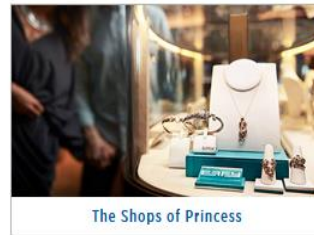
The Shops of Princess