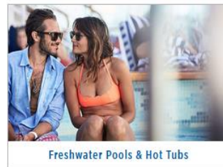
Freshwater Pools & Hot Tubs