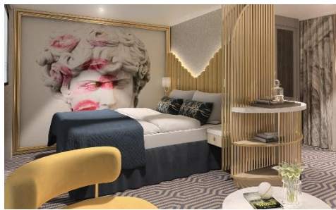
<--- Palace Deluxe Suite

เพื่อประโยชน์ของผู้เดินทาง โปรดศึกษาเงื่อนไขการจองทัวร์ และการยกเลิกทัวร์ ที่ระบุในรายการทั้งหมด หลังจากท่านทำการจองทัวร์แล้ว ทางบริษัทจะถือว่าท่านเข้าใจ และพร้อมปฏิบัติตามเงื่อนไขดังกล่าว