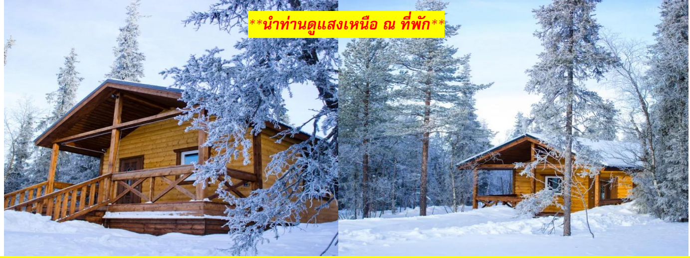
**นำท่านดูแสงเหนือ ณ ที่พัก**

*** การพบเห็นปรากฏการณ์แสงเหนือ เป็นปรากฏการณ์ทางธรรมชาติ ไม่สามารถกำหนดหรือทราบล่วงหน้าได้ โอกาสที่จะได้เห็นขึ้นอยู่กับสภาพอากาศเป็นสำคัญ โดยช่วงปลายฤดูใบไม้ร่วงจนถึงต้นฤดูใบไม้ผลิ ในเดือนตุลาคม กุมภาพันธ์ และ มีนาคม เป็นเดือนที่เหมาะสมสำหรับการชมออโรราทางซีกโลกเหนือ มักจะเกิดในช่วงเวลาที่ห่มจนถึงเที่ยงคืน และโปรแกรมอาจมีการปรับเปลี่ยนได้ตามความเหมาะสม***