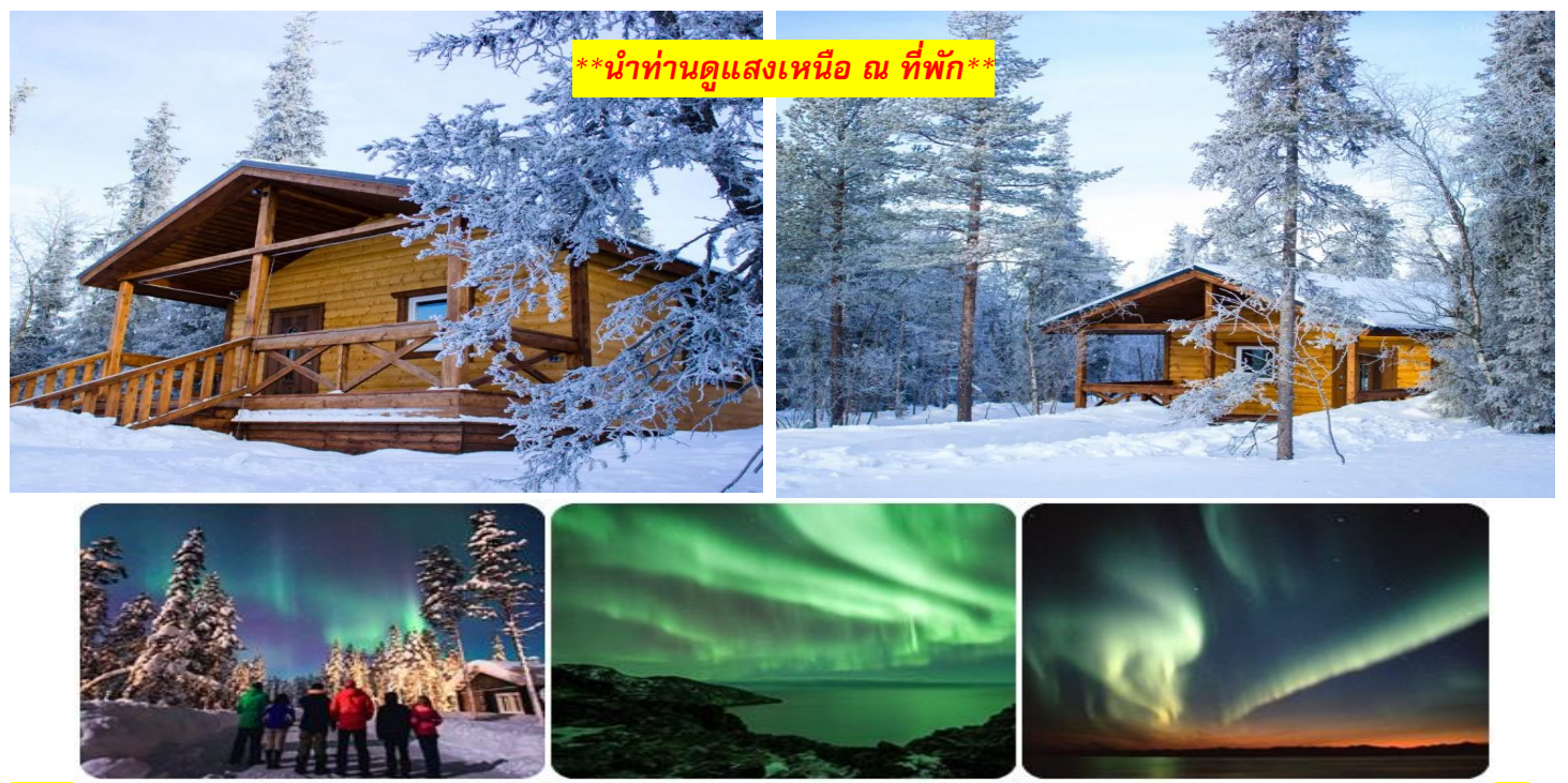
**นำท่านดูแสงเหนือ ณ ที่พัก**

*** การพบเห็นปรากฏการณ์แสงเหนือ เป็นปรากฏการณ์ทางธรรมชาติ ไม่สามารถกำหนดหรือทราบล่วงหน้าได้ โอกาสที่จะได้เห็นขึ้นอยู่กับสภาพอากาศเป็นสำคัญ โดยช่วงปลายฤดูใบไม้ร่วงจนถึงต้นฤดูใบไม้ผลิ ในเดือนตุลาคม กุมภาพันธ์ และ มีนาคม เป็นเดือนที่เหมาะสมสำหรับการชมออโรราทางซีกโลกเหนือ มักจะเกิดในช่วงเวลาที่มืดจนถึงเที่ยงคืน และโปรแกรมอาจมีการปรับเปลี่ยนได้ตามความเหมาะสม***