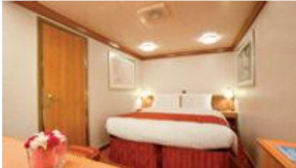
inside ห้องไม่มีหน้าต่างด้านใน