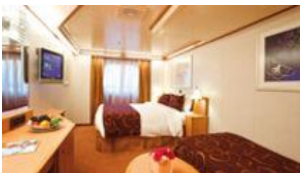
Outside ห้องมีหน้าต่าง