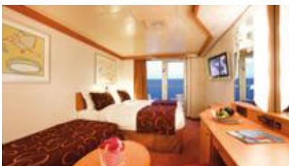
Balcony ห้องมีระเบียง