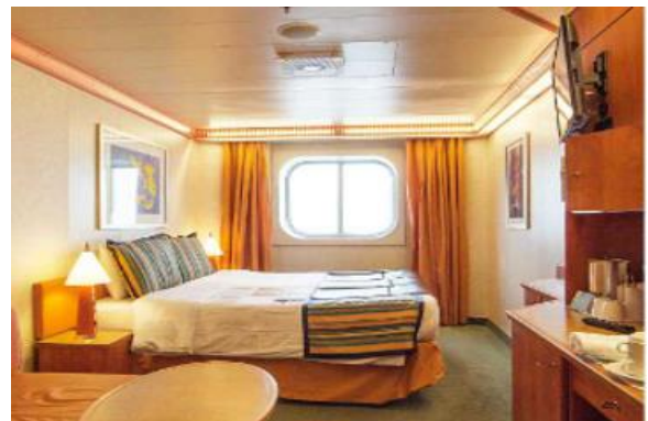
ห้องมีหน้าต่าง Outside