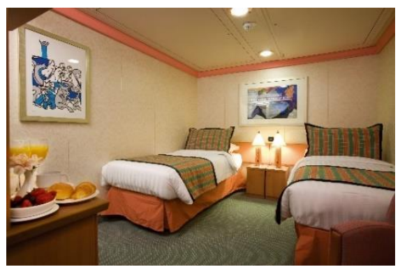
ห้องไม่มีหน้าต่าง ด้านใน Inside

คำแนะนำ : ก่อนจอง และชำระค่าเดินทาง โปรดศึกษาเงื่อนไขการจอง และการยกเลิกทัวร์อย่างละเอียด เพื่อรักษาสีสิทธิ์ในการเดินทางของท่าน