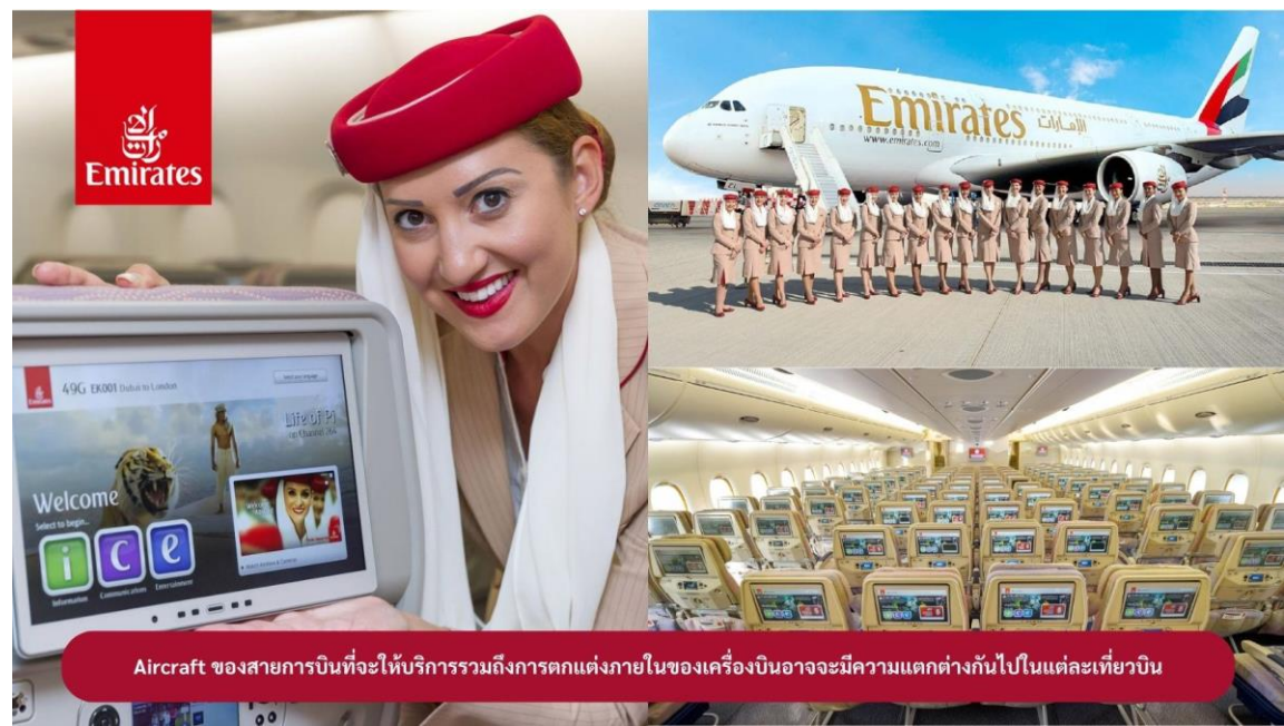
Aircraft ของสายการบินที่จะให้บริการรวมถึงการตกแต่งภายในของเครื่องบินอาจจะมีความแตกต่างกันไปในแต่ละเที่ยวบิน

23.00 น. !!!! คณะเดินทางพร้อมกัน ณ สนามบินสุวรรณภูมิ อาคารผู้โดยสารขาออก ระหว่างประเทศ ชั้น 4 ประตู 9 แถว T สายการบินเอมิเรตส์ แอร์ไลน์ (EK) เจ้าหน้าที่ให้การต้อนรับและอำนวยความสะดวก