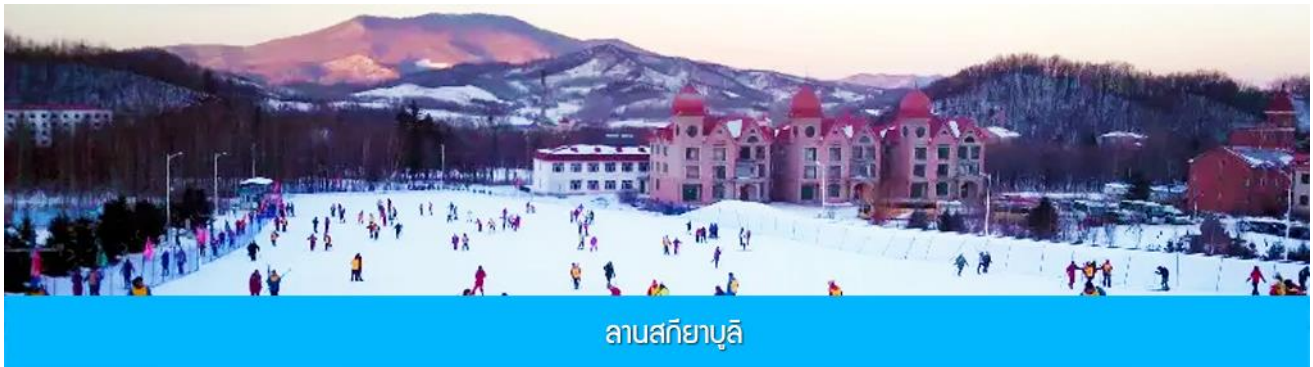
ลานสกียาบูลิ

พักที่ HARBIN REZEN HOTEL โรงแรมระดับ 4 ดาวห้องดีนหรือเทียบเท่า ในเมืองฮาร์บิน