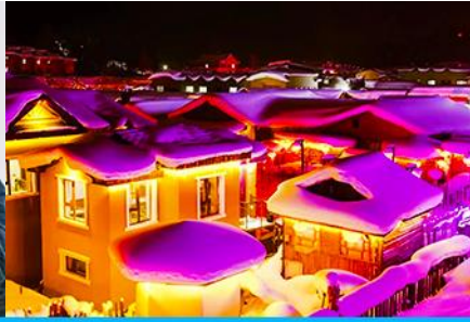
เมืองหิมะ: Xue xiang