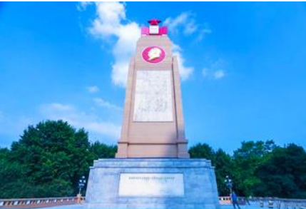
อนุสาวรีย์ป้องกันอุทกภัย