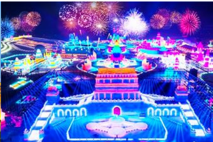
เทศกาลแกะสลักน้ำแข็งนานาชาติ