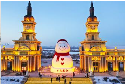
ตุ๊กตาหิมะยักษ์