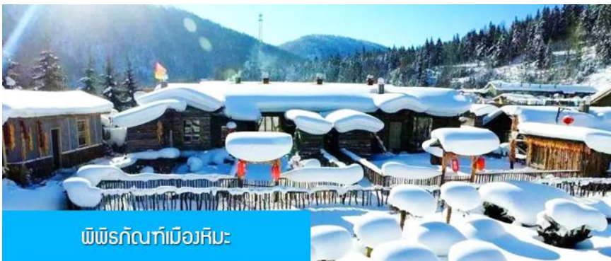
พิพิธภัณฑ์เมืองหิมะ

หมายเหตุ การไปพักในเมืองหิมะทางทัวร์ไม่สามารถจัดรถทัวร์ไปส่งรถทัวร์ถึงหน้าโฮมสเตย์ได้ ทางคณะต้องนั่งรถเมล์หมู่บ้านเข้าไป โดยรถทัวร์ต้องถือหรือลากกระเป๋าเข้าที่พักด้วยตัวเอง เพราะโฮมสเตย์จะไม่มีพนักงานยกกระเป๋ามาคอยบริการยกกระเป๋าให้ผู้เข้าพัก ท่านควรจัดเตรียมกระเป๋าใบเล็กที่บรรจุเสื้อผ้า และเครื่องใช้จำเป็นสำหรับการพักแรม ณ โฮมสเตย์ในเมืองหิมะในคืนนี้ เพื่อสะดวกต่อการเคลื่อนย้ายกระเป๋า, และภายในห้องพักจะไม่มีผ้าเช็ดตัวผืนใหญ่ จะมีเพียงสบู่ แชมพูบริการทุกโรงแรม ท่านควรเตรียมแปรงสีฟันยาสีฟันติดไปด้วย