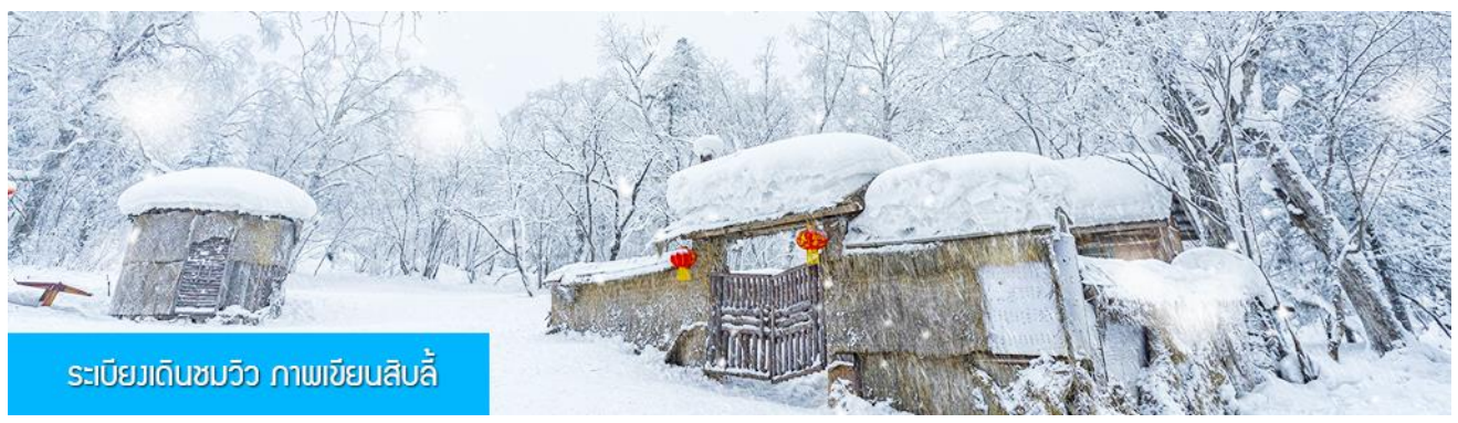
ระเบียบเดินชมวิว ภาพเขียนสิบลี้

รายการที่ 1 ระเบียบเดินชมวิว ภาพเขียนสิบลี้ 冰雪十里画廊 เป็นการเดินชมวิวธรรมชาติตามเนินเขา ท่ามกลางแนวป่าที่มีต้นไม้ที่มีน้ำแข็งเกาะอยู่ตามกิ่งไม้ เป็นภาพวิวธรรมชาติฤดูหนาวที่สวยงามน่าประทับใจและพบได้เฉพาะในฤดูหนาวทางภาคอีสานของจีนเท่านั้น เวลาที่ใช้สำหรับโปรแกรมเสริมนี้ประมาณ 1 ชั่วโมง อัตราค่าบริการ ท่านละ 220 หยวน หรือ 1100 บาท อัตรานี้รวมค่าบริการผ่านเข้าอุทยาน ค่ารถรับ ส่ง และค่าบริการของไกด์ท้องถิ่น และค่าบริการจัดการของบริษัททัวร์ท้องถิ่น หมายเหตุ โปรแกรมเสริมเป็นโปรแกรมที่ท่านต้องเสียค่าใช้จ่ายเองด้วยความสมัครใจ สำหรับท่านที่ไม่เข้าร่วมกิจกรรมดังกล่าวสามารถนั่งพักในรถได้