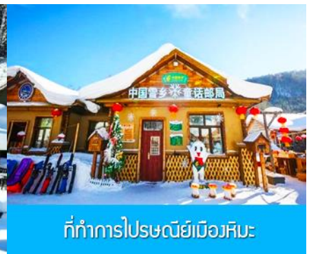
ที่ทำการไปรษณีย์เมืองหิมะ

วันที่ดี พิพิธภัณฑ์เมืองหิมะ - ที่ทำการไปรษณีย์เมืองหิมะ - ไกด์ขายออฟชั่นภาพเขียนสิบลี-และออฟชั่นม้าลากเลื่อน-เมืองฮาร์บิน