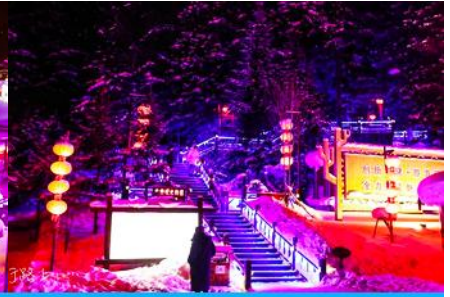
ระเบียงชมวิว ปังจฺยฺชาน