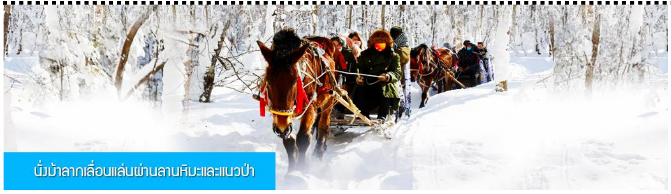
นั่งม้าลากเลื่อนเล่นผ่านลานหิมะและแนวป่า

รายการที่ 1 ระเบียบเดินชมวิว ภาพเขียนสิบลี้ 冰雪十里画廊 เป็นการเดินชมวิวธรรมชาติตามเนินเขา ท่ามกลางแนวป่าที่มีต้นไม้ที่มีน้ำแข็งเกาะอยู่ตามกิ่งไม้ เป็นภาพวิวธรรมชาติฤดูหนาวที่สวยงามน่าประทับใจและพบได้เฉพาะในฤดูหนาวทางภาคอีสานของจีนเท่านั้น เวลาที่ใช้สำหรับโปรแกรมเสริมนี้ประมาณ 1 ชั่วโมง อัตราค่าบริการ ท่านละ 220 หยวน หรือ 1100 บาท อัตรานี้รวมค่าบริการผ่านเข้าอุทยาน ค่ารถรับ ส่ง และค่าบริการของไกด์ท้องถิ่น และค่าบริการจัดการของบริษัททัวร์ท้องถิ่น หมายเหตุ โปรแกรมเสริมเป็นโปรแกรมที่ท่านต้องเสียค่าใช้จ่ายเองด้วยความสมัครใจ สำหรับท่านที่ไม่เข้าร่วมกิจกรรมดังกล่าวสามารถนั่งพักในรถได้