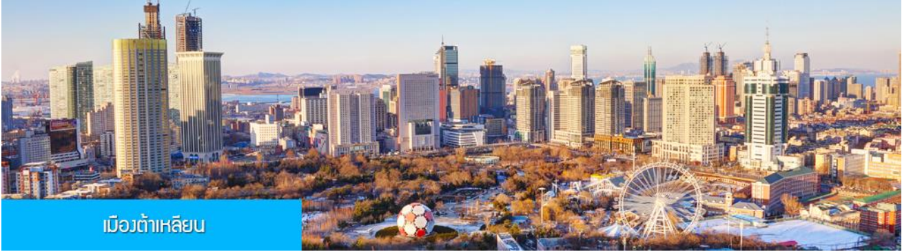
เมืองต้าเหลียน