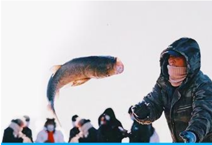
การจับปลาในฤดูหนาว