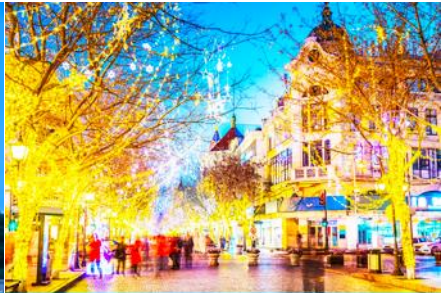
ถนนจยงลู่

วันที่ห้า เมืองฮาร์บิน –โบสถ์โซเฟีย - อนุสาวรีย์ป้องกันอุทกภัย –ถนนจยงลู่ –นั่งรถไฟความเร็วสูงกลับเมืองต้าเหลียน - จัตุรัสซิงไห่ - ถนนรัสเซีย