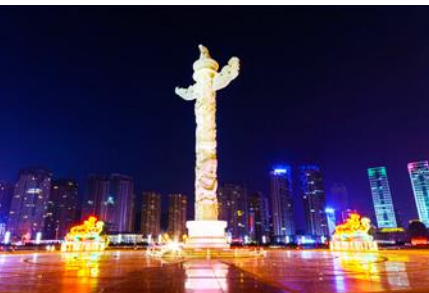
จัตุรัสซิงไห่