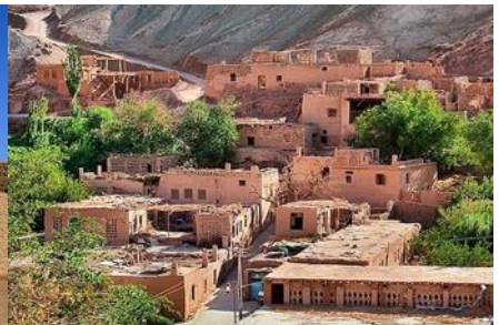
หมู่บ้านอูยกูร์

4 Sep 67 ชมระบบชลประทานถู่หลู่ฟาน - ถ้ำพระพันองค์ - เมืองโบราณเกาซางกู่เฉิง-หมู่บ้านอูยกูร์ - เดินทางสู่เมืองอูร์มูฉี