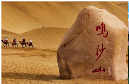
เป็นทรายหมีชาซาน

พักที่ REZEN HOTEL ระดับ 4 ดาวท้องถิ่นหรือเทียบเท่าในเมือง เจียยวี่กวน