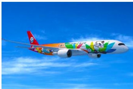
บินภายในสู่หลัวโจว