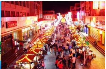
ตลาดกลางคืน ซาโจว