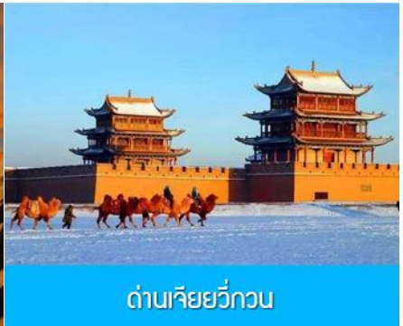
ด่านเจียวกวน