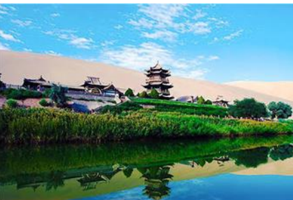
สระน้ำวังพระจันทร์