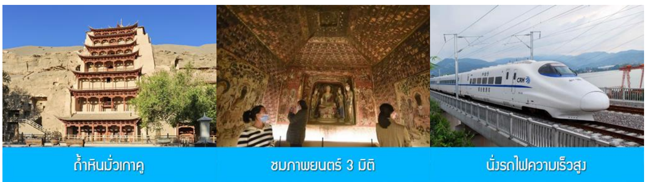
ถ้ำหินมั่วเกาคุ

พักที่ METRO PARK HOTEL โรงแรมระดับ 4 ดาวหรือเทียบเท่าในเมืองตุนหวง