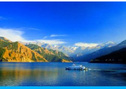
ล่องเรือทะเลสาบเทียนฉือ