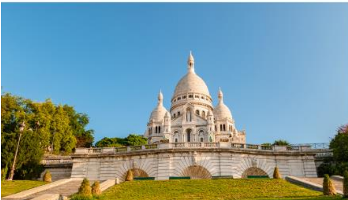
13.00 ให้ท่านได้เปิดประสบการณ์ขึ้นชมวิวแบบพาโนรามาบนชั้น 1 ของหอไอเฟล แลนด์มาร์คที่โด่งดังของปารีสและนำท่านเที่ยวชมมงต์มาร์ต (Montmartre) ย่านดังที่ตั้งอยู่บนเนินเขาสูง 130 เมตร ทางทิศเหนือของกรุงปารีส (Paris) เป็นแหล่งแอคท์ชั้นยอดของกรุงปารีสที่ห้อมล้อมไปด้วยสถาปัตยกรรมเก่าแก่ พิพิธภัณฑ์ ร้านค้า ร้านอาหาร คาเฟ่สุดชิค และเป็นสถานที่ถ่ายทำภาพยนตร์ชื่อดัง จอห์น วิก สามารถมองเห็นปารีส แบบพาโนรามา