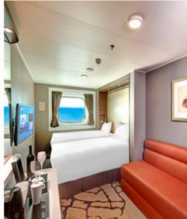
Oceanview Stateroom with Window