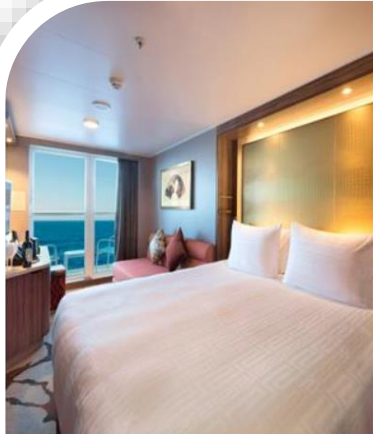
Oceanview Stateroom with Balcony