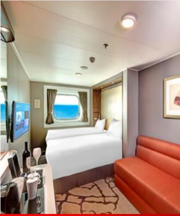
Oceanview Stateroom with Window