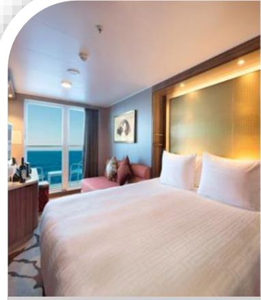
Oceanview Stateroom with Balcony