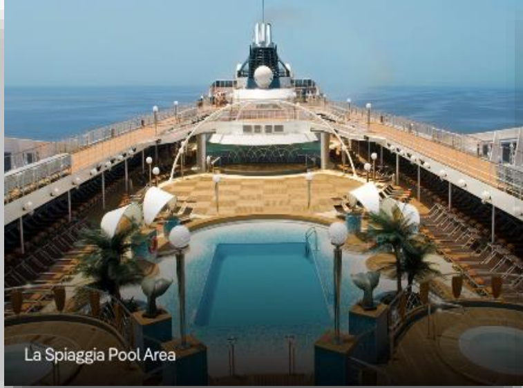
La Spiaggia Pool Area