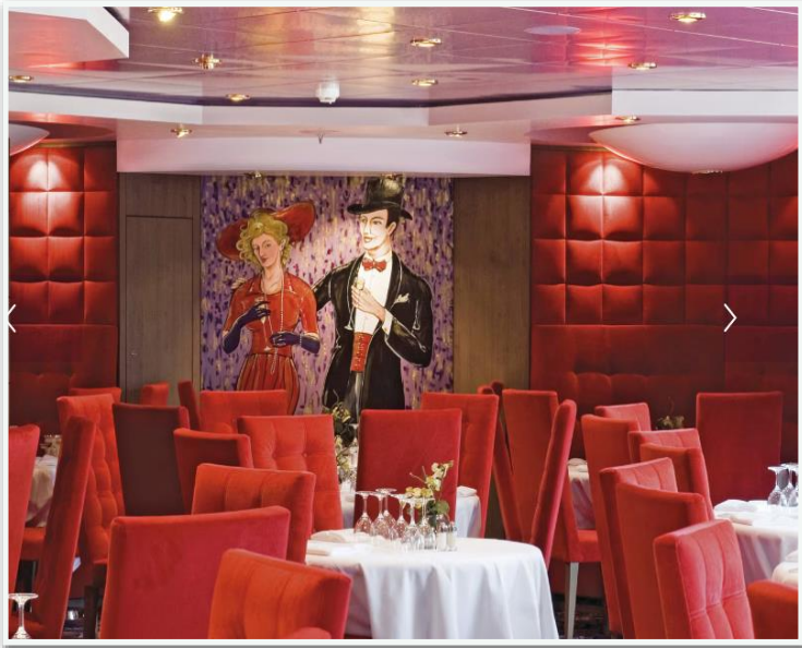
Gli Archi Buffet Restaurant