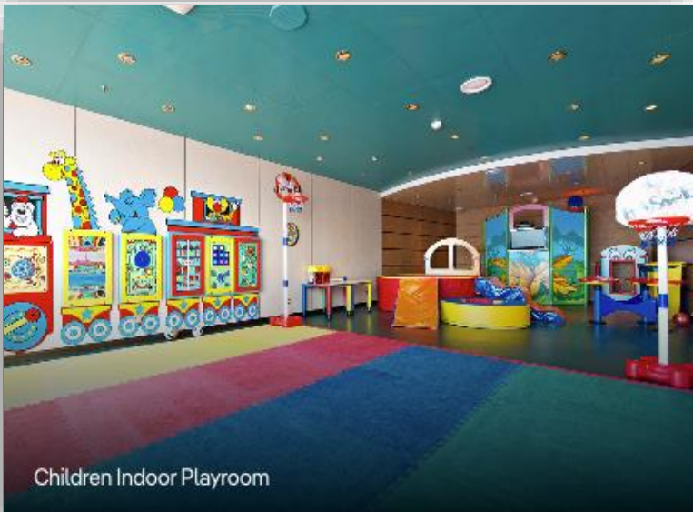
Children Indoor Playroom