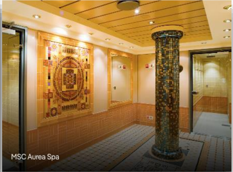
MSC Aurea Spa