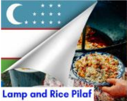
Lamp and Rice Pilaf