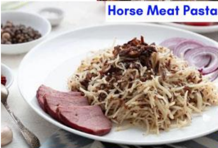
Horse Meat Pasta