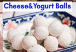
Cheese & Yogurt Balls